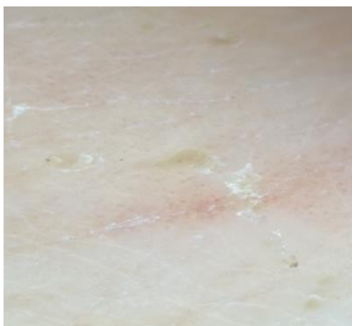
Рисунок 2. Дерматоскопическая картина чесотки, визуализируется чесоточный ход и самка чесоточного клеща в виде черного треугольника на конце

Таким образом, несмотря на доступность противочесоточных средств, современных методов диагностики – дерматоскопии, проблема чесотки до сих пор актуальна. В связи с этим дерматовенерологической службе необходимо информировать врачей всех специальностей об особенностях клинических проявлений различных форм чесотки для своевременного ее выявления. Проводить информационную работу по профилактике чесотки среди населения.