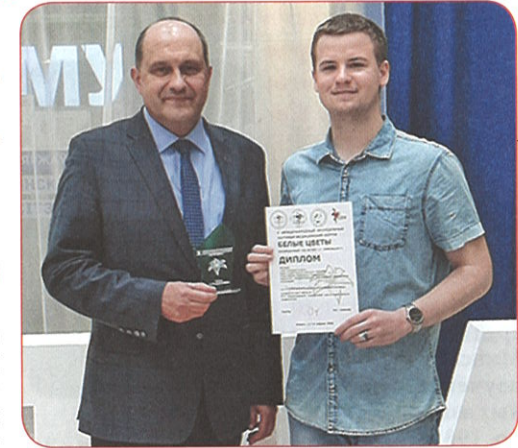
дарственный медицинский университет и БГМУ.

На заседании секции по судебной медицине были заслушаны доклады представителей крупнейших медицинских вузов, в числе которых Российский национальный исследовательский медицинский университет им. Н. И. Пирогова, Казанский госу-