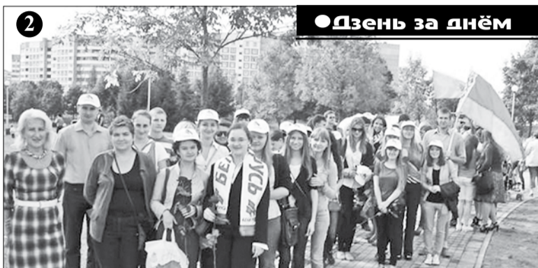
● День за днём

Деятельность общественного объединения БГМУ проводится в соответствии с планом работы первичной организации УО «Белорусский государственный медицинский университет» Московской районной организации Республиканского общественного объединения «Белая Русь». В нем нашла свое отражение работа по духовному и нравственному воспитанию студентов и молодых преподавателей, а также материальная поддержка детей-инвалидов, забота о ветеранах Великой Отечественной войны, мероприятия по поддержанию здоровья ветеранов войны в Афганистане. В стенах университета состоялась встреча с ветераном Великой Отечественной войны, членом «Белорусского союза блокадников