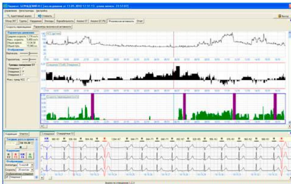
Рис. 3. Формат представления данных о физической активности пациента

Интерфейс программы оценки физической активности