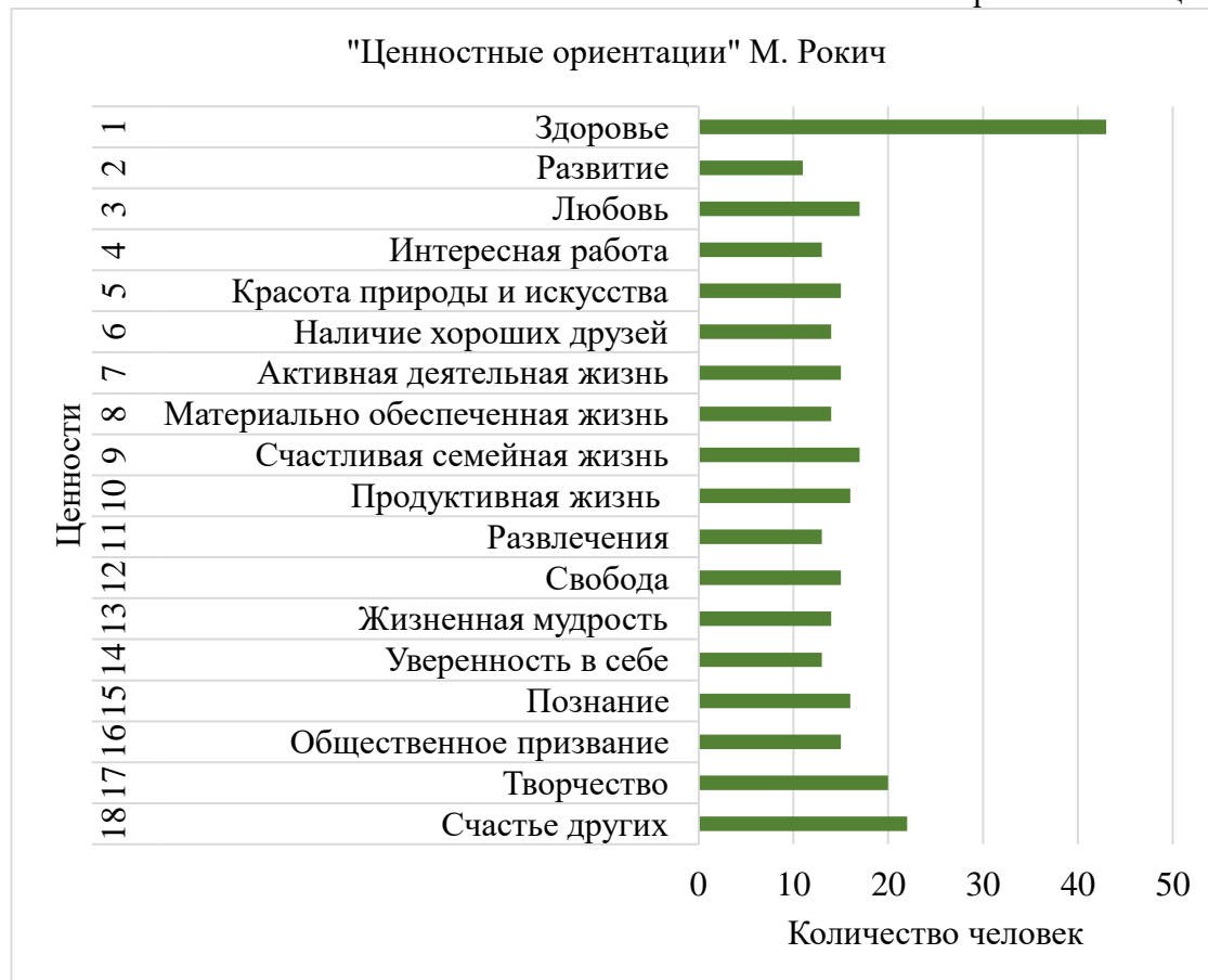
Рис. 1 – Терминальные ценности

Безусловно, выбор студентами ценности «здоровье» является положительным показателем, особенно для будущих медицинских работников. Молодые люди должны осознавать, что выбирая путь врача, охрана собственного здоровья – это необходимость данного образа жизни для развития и сохранения личного и общественного здоровья. Здоровый образ жизни студента медицинского вуза выступает как образовательная ценность, так как студент сам должен показывать личный пример ведения здорового образа жизни.