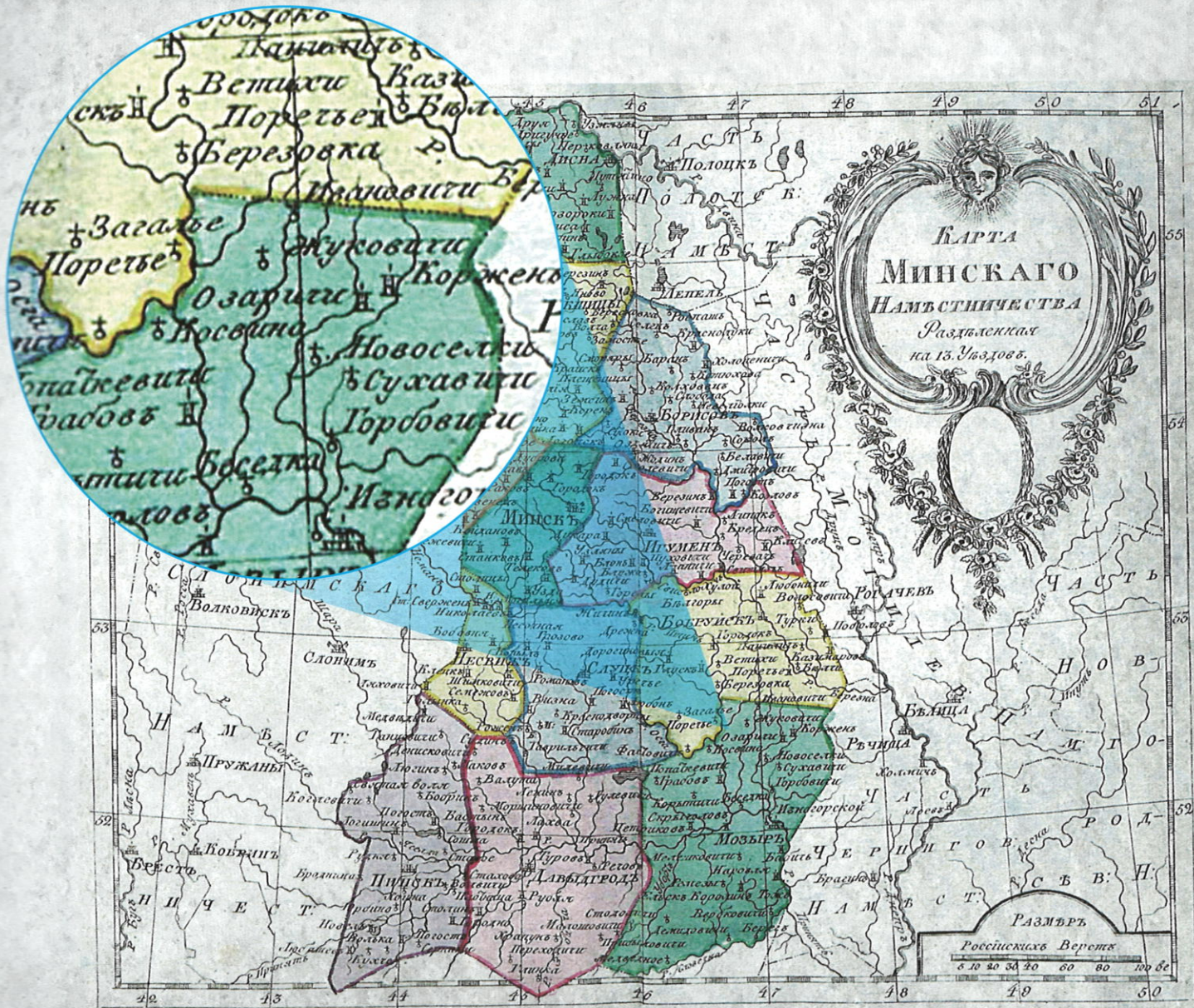
Ozarichi на карте Минскаго намѣстничества. 1796 г. Ozarichi on the map of Minsk viceregency. 1796. Osaritschi auf der Karte der Statthallerei Minsk. 1796.