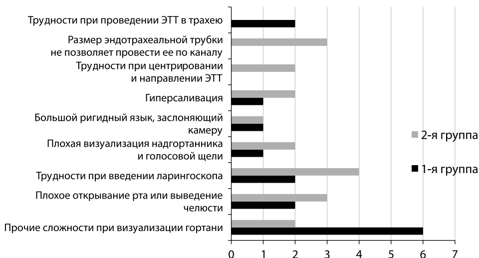
Рис. 2. Причины и обстоятельства, препятствовавшие успешной интубации трахеи при помощи видеоларингоскопа Fig. 2. The reasons and circumstances that prevented the successful intubation of the trachea by using a videolaryngoscope

Одной из наиболее частых причин, которые препятствовали успешной интубации трахеи, является невозможность направить ЭТТ в просвет гортани (несмотря