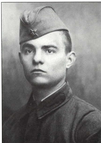
До войны оставалось 12 дней