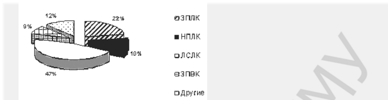
Рис.1. Распределение больных с патологией кистевого сустава

несросшийся перелом (НПЛК) – 6 (9%); ложный сустав (ЛСЛК) – 27 (47%); закрытый перилунарный вывих кисти и вывих полулунной кости (ЗПВК) – 7 (9%).