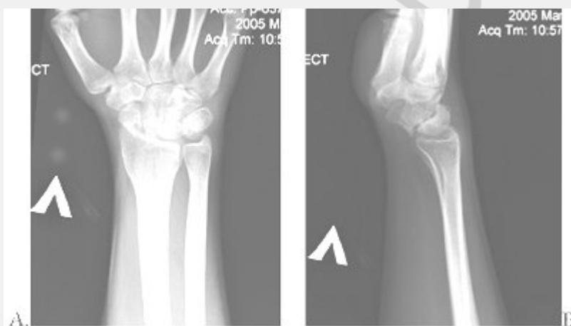
Рис. 2. Рентгенограммы больного К. в начале лечения: А-прямая проекция, Б-боковая проекция.

На контрольной рентгенограмме были выявлены типичные признаки ладонного переломовывиха, установлен диагноз: Застарелый ладонный чрезладьевидный перилунарный вывих кисти (Рис. 2).