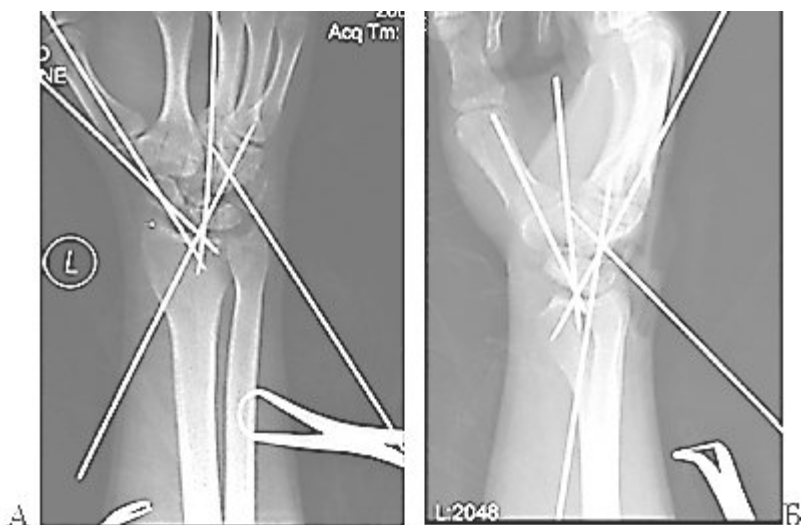
Рис. 3. Интраоперационные рентгенограммы больного К.: А-прямая проекция, Б-боковая проекция.

В связи с большим сроком с момента травмы походу операции были технические трудности в процессе выделения костей из рубцов и репозиции фрагментов ладьевидной кости. В итоге, взаимоотношения в кистевом суставе были восстановлены.