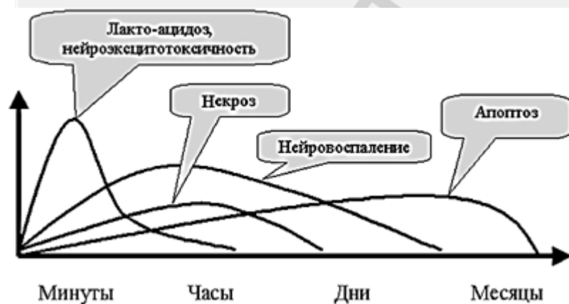
Рис.1. Схема выраженности различных механизмов патогенеза в разные периоды разрыва аневризмы.

Запуск процесса апоптоза находится под контролем множества внеклеточных и внутриклеточных механизмов [11]. Судьба клетки зависит от баланса между этими сигналами (Рис.1) [19].