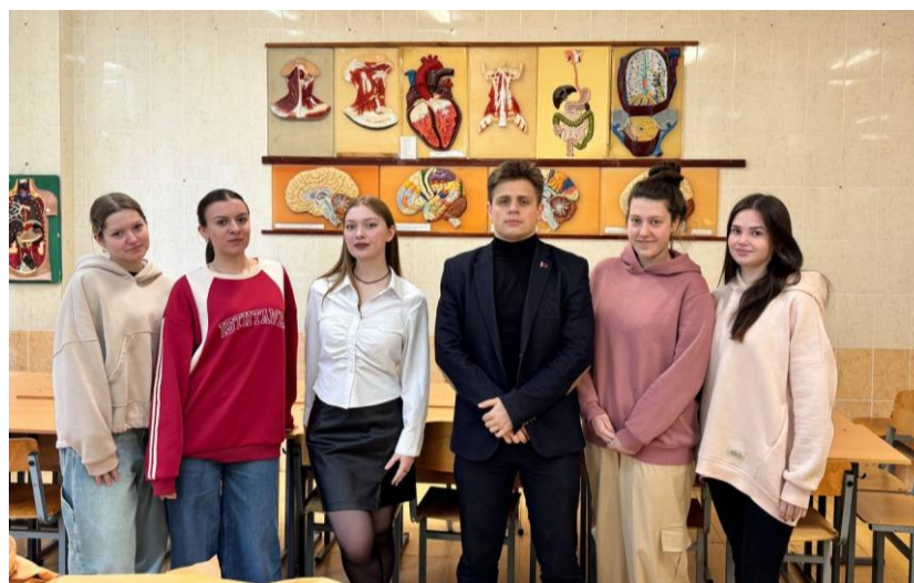
Рис. 3 Консультанты кружка 2024/2025

Консультантами являются студенты старших курсов – это актив кружка с большим опытом работы, неоднократные призеры олимпиад, хорошо владеющие анатомическим материалом и умеющие понятно и доступно объяснять материал (рис. 3). Важно отметить, что консультанты проходят строгий отбор.