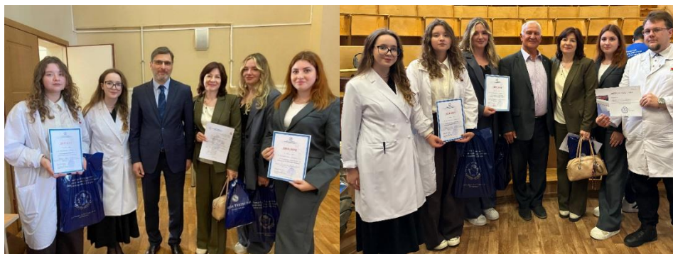
Рис. 10. Участие команды БГМУ в олимпиаде по анатомии человека в г. Санкт-Петербурге

В мае 2025 года команда БГМУ впервые приняла участие в VIII открытой студенческой Олимпиаде по анатомии человека Первого Санкт-Петербургского государственного медицинского университета имени академика И.П. Павлова (рис. 10).