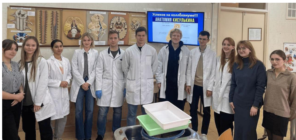
Рис. 2 Теоретическое занятие в СНК

В кружке регулярно проводятся заседания по подготовке к практическим занятиям по анатомии человека, которые помогают студентам 1-2 курсов глубже понять и систематизировать материал по этой сложной дисциплине (рис. 2). Занятия проводятся каждую субботу в две смены с 9 до 13 часов для студентов лечебного, педиатрического, медико-профилактического факультетов, а также на английском языке для студентов медицинского факультета иностранных учащихся.