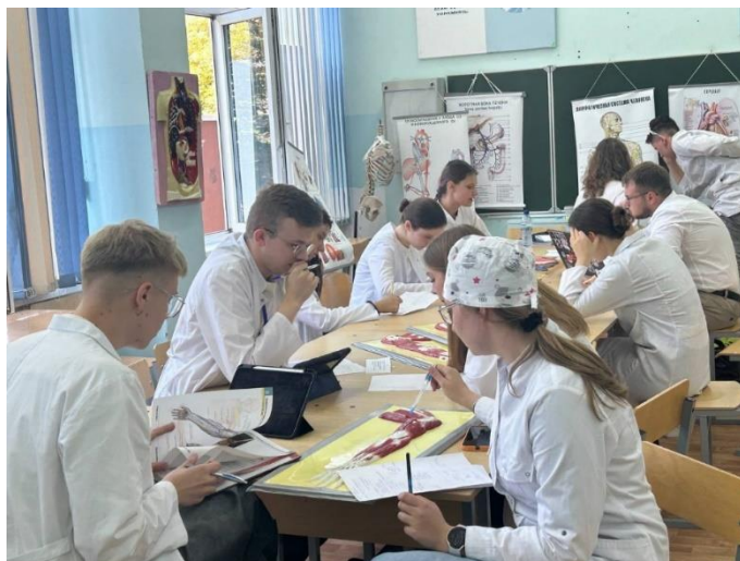
Рис. 7. Подготовка олимпиадников

Цель курса: углубить знания по нормальной и топографической анатомии, подготовить студентов к участию в олимпиадах, развить логическое мышление и клинико-анатомический подход. Структура занятий строится на углубленном изучении макро- и микроанатомии, изучении анатомии по областям тела, запоминание эпонимов. Теоретическая подготовка также включает решение клинических задач, практическая работа с анатомическими препаратами, электронными 3D атласами, схемами, муляжами и макетами.