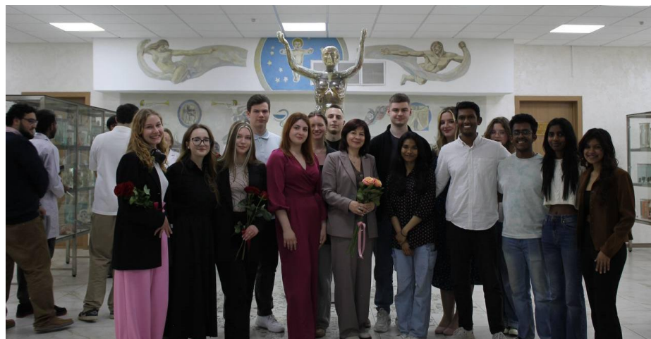
Рис. 1 Актив кружка СНК 2024/2025

Студенческий научный кружок (СНК) кафедры нормальной анатомии Белорусского государственного медицинского университета функционирует уже более 100 лет. За это время сформировалась целая плеяда известных ученых, преподавателей и врачей, которые начинали свой путь именно в этом кружке. СНК кафедры славится многогранностью своей деятельности: теоретическая подготовка студентов к практическим занятиям, подготовка студентов к международным студенческим олимпиадам, проведение мастер-классов практикующими врачами, проведение анатомических квизов, конкурсов рисунков, занятий по препарированию, особое внимание уделяется научно-исследовательской работе (рис. 1).