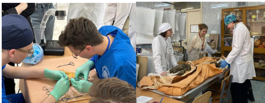
Рис. 6. Школа препарирования

Школа препарирования – уникальный образовательный проект СНК кафедры нормальной анатомии, дающий возможность студентам прикоснуться к настоящей анатомической практике с самых первых курсов (рис. 6). Студентам необходимо пройти специальный отбор, который выявляет не только теоретическую подготовку, но и умение ориентироваться при работе с трупным материалом. По итогам отбора 20 лучших студентов получают возможность обучаться в Школе препарирования.