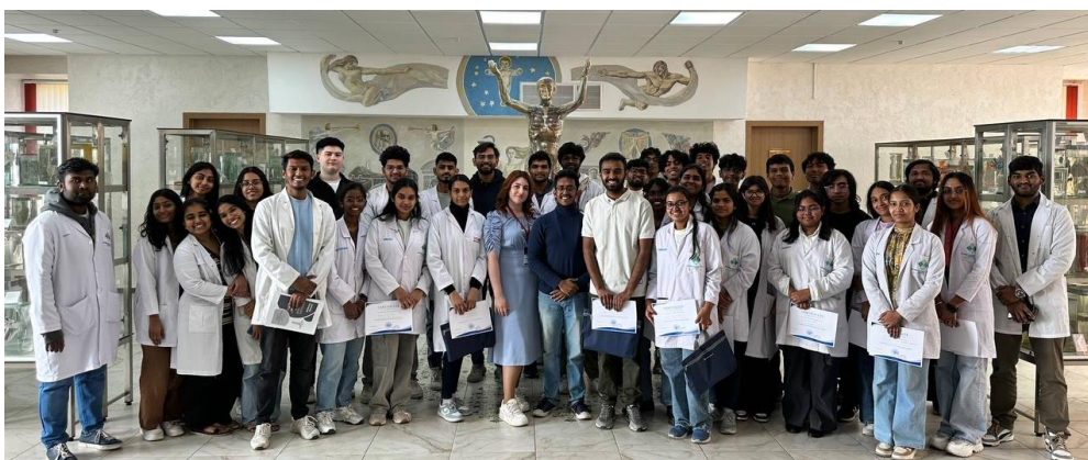
Рис. 9. Первая внутривузовская олимпиада по анатомии человека для англоязычных студентов (май 2025г)

Впервые 3 мая 2025 года была проведена внутривузовская олимпиада по анатомии человека на английском языке (рис. 9). В ней приняли участие студенты 1 курса медицинского факультета иностранных учащихся. Студенты выполняли задания на протяжении 2 часов, показали высокий уровень знаний по микро- и макроанатомии, анатомической терминологии. Особое внимание уделялось визуальным изображениям, схемам и 3D-моделям. Первая олимпиада стала важной вехой для англоязычного отделения СНК. Победители были награждены дипломами и призами от спонсоров.