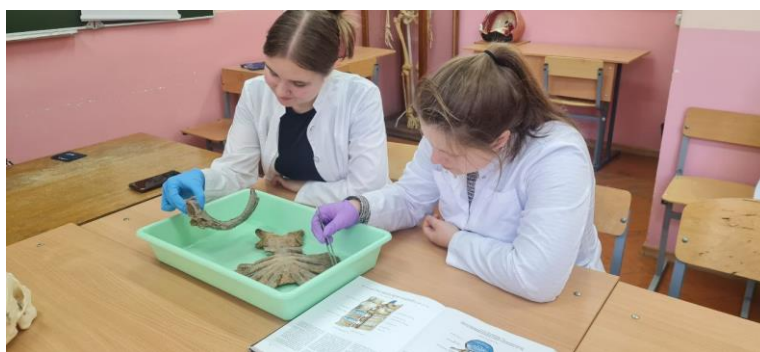
Рис. 4 Изучение анатомии на анатомических препаратах в рамках СНК

Такие занятия – отличная возможность подготовиться к практическим занятиям по анатомии человека без стресса, закрепить материал при живом общении, научиться думать, как будущий врач и анатомически грамотно рассуждать. Занятия проходят в формате «студент-студенту», что создает комфортную обстановку и делает обучение более доступным и эффективным.