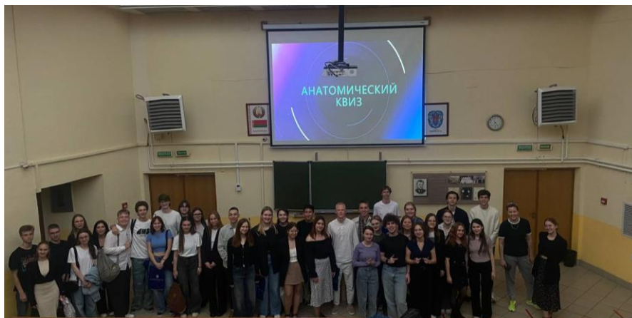
Рис. 8 Проведение анатомического квиза

развивать командное мышление и реакцию. Победители всегда награждаются дипломами и ценными призами.