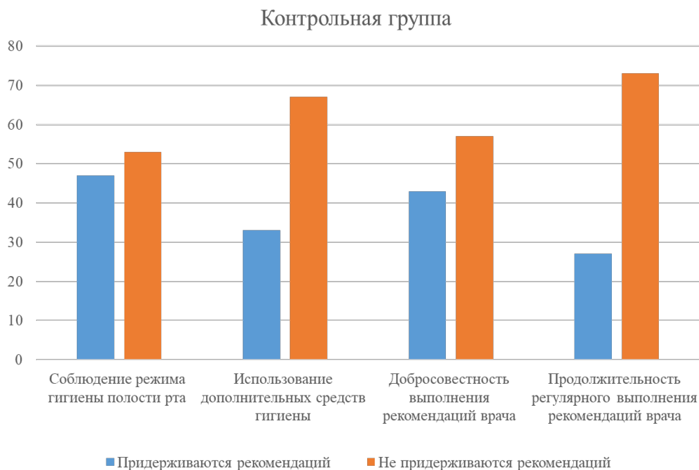
Диагр. 1 – Результаты анкетирования контрольной группы

Результаты и их обсуждение. В результате исследования выявлено, что после демонстрации пациентам тестовой группы модифицированной пародонтальной карты соблюдение режима гигиены полости рта и использование дополнительных средств гигиены выросло на 77% и 63% соответственно, в то время как в контрольной группе данные показатели выросли на 47% и 33% соответственно. Добросовестность выполнения рекомендаций врача и продолжительность их регулярного выполнения среди пациентов тестовой группы составила 73% и 83% соответственно, когда в контрольной группе – 43% и 27% соответственно.