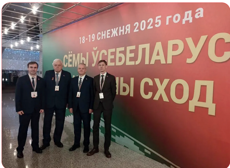
В кулуарах VII Всебелорусского народного собрания

Для студентов, проживающих в общежитиях БГМУ, также были проведены информационные часы. Спикеры в лице студентов, активистов ПО ОО «БРСМ» вместе с участниками встреч определили значимость ВНС в жизни нашего государства, где молодежь принимает свое непосредственное участие.