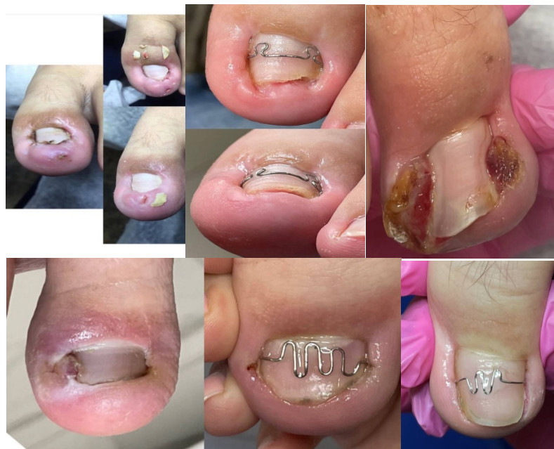
Рис. 6 – Динамика восстановления ногтевого аппарата

В сроки от 6 месяцев до 1 года было проведено комплексное восстановление ногтевого аппарата у выше изложенных пациентов методом ортониксия с применением корректирующих ортезов для нормализации биомеханики. Контрольный осмотр пациентов осуществлялся через 1, 3, 6 и 12 месяцев после окончания лечения. Полное восстановление ногтевой пластинки у пациентов с вросшим ногтем методом ортониксия наблюдалось у 50 пациентов (100%). Ни в одном случае каких-либо отдаленных осложнений отмечено не было.