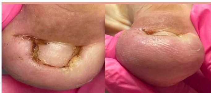
Рис. 3 – Рецидивирование заболевания с осложнением

Поэтому необходимость разработки и клинической апробации новых минимально инвазивных методов лечения онихокриптоза не вызывает сомнения и в перспективе позволит улучшить результаты лечения в указанной группе пациентов.