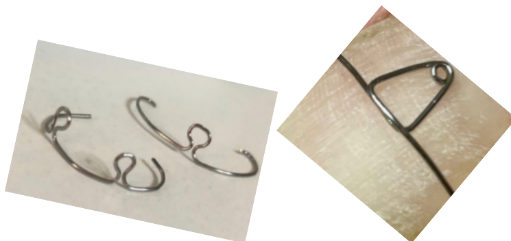
Рис. 5 – Формы специальных скоб, устанавливаемых на ноготь

В 98 % случаях вросший ноготь сочетался с вальгусной патологией стоп. 12 пациентов (63,5 %), из первично обратившихся, отказались от операции, 3 пациента (15,8 %) имели противопоказания к ней, 4 пациента (21 %) имели положительный анализ на онхомикоз [4]. Всем пациентам было выполнено восстановление ногтевого аппарата методом ортониксии посредством установки специально изготовленной скобы из проволоки пружинной нержавеющей стали из биосовместимых материалов (Рис – 5).