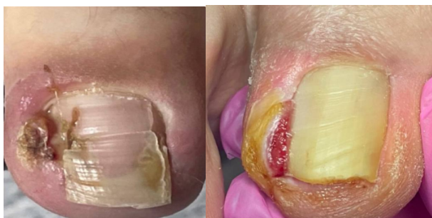
Рис. 1 – Рецидивирование заболевания

Лечение вросшего ногтя или онихокриптоза представляет серьезную медико-социальную проблему, требующую персонализированного подхода для ее решения. Указанное заболевание является одной из наиболее частых причин обращения за хирургической помощью в амбулаторных условиях, составляя от 3 до 10% от всех визитов к врачу-хирургу поликлиники [1]. Онихокриптоз относится к полиэтиологическим заболеваниям и может быть обусловлен целым рядом причин: наследственным фактором, поперечно-продольным плоскостопием[2], вальгусной деформацией I плюснефалангового сустава и другими деформациями стопы, неправильно выполненным педикюром, травмой, термическим ожогом, осложнениями после приема противоопухолевых препаратов, аутоиммунными и онкологическими заболеваниями (Рис. 1).