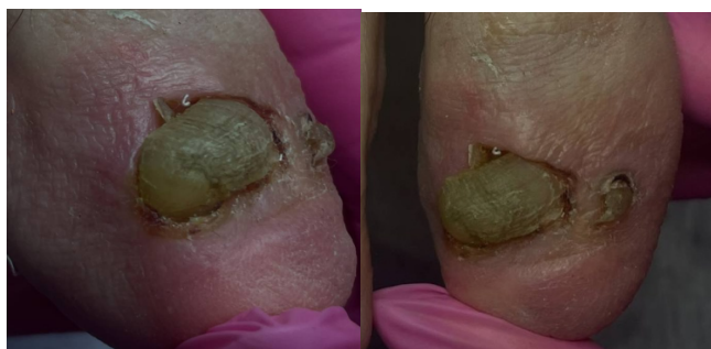
Рис. 2 – Осложнение после хирургического лечения

Вросшему ногтю присуща совокупность морфофункциональных изменений со стороны ногтей пальцев стоп, матриксов и ногтевого ложа[3]. Консервативные, в том числе и ортопедические, приемы лечения вросшего ногтя малоэффективны, а операции по Дюпюитрену, Шмидену очень травматичны, обезображивают палец и к тому же в 20-50% случаев приводят к рецидивам(Рис. 2).