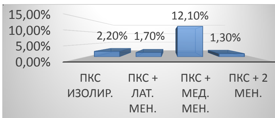
Рисунок 1. – Частота различных травм передней крестообразной связки

Результаты и выводы. В ходе исследования установлено, что одним из основных факторов, способствующих травматизму коленного сустава, является слабость мышц и пассивных стабилизаторов коленного сустава (крестообразные связки, коллатеральные связки и мениски). Было выявлено, что изолированные повреждения передней крестообразной связки обнаружены у 5 (2,2 %) пациентов, сочетанные с травмой медиального мениска – у 27 (12,1 %), латерального мениска – у 4 (1,7 %) и обоих менисков – у 3 (1,3 %) пациентов (рисунок 1).