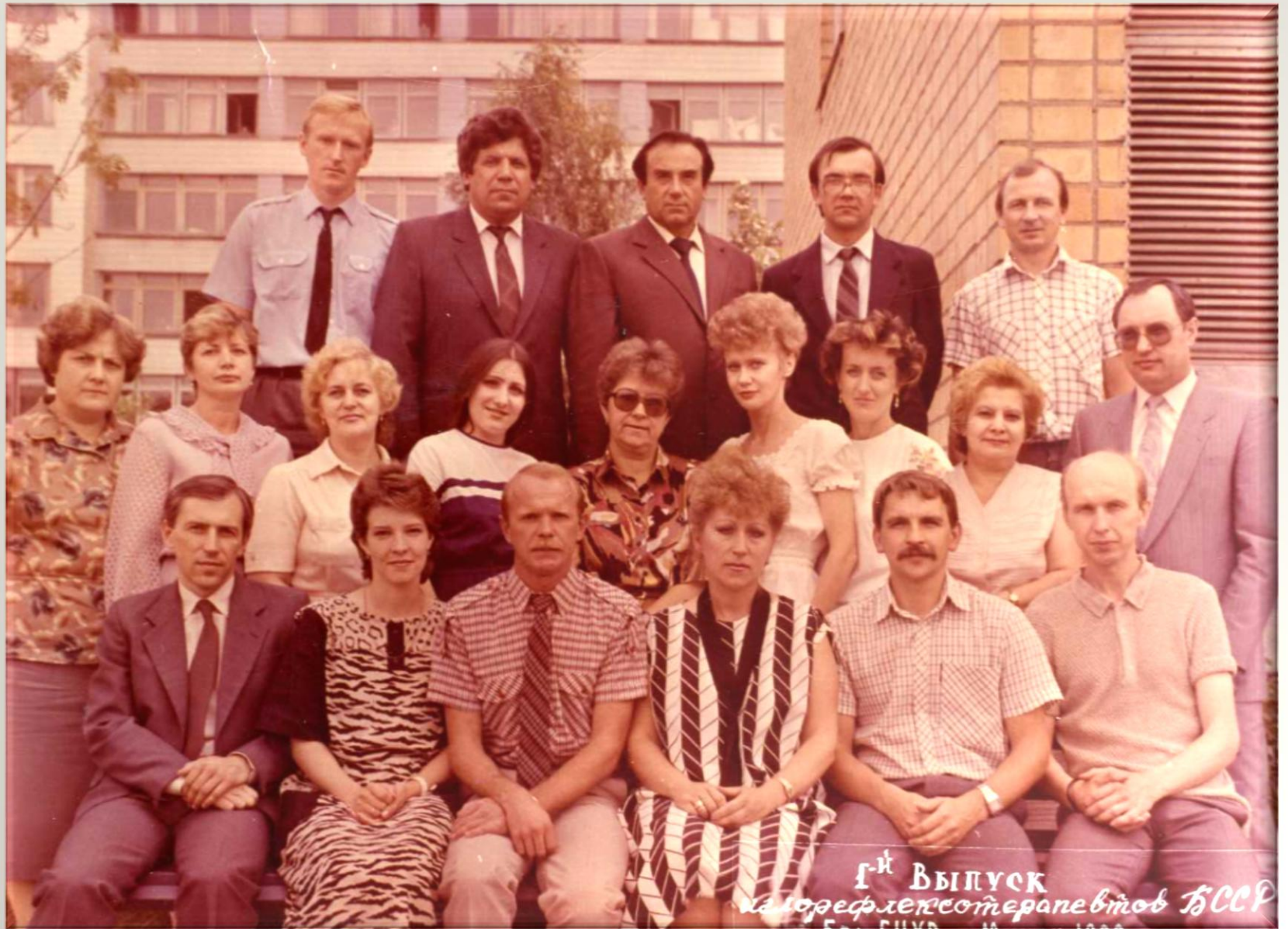
Г-н ВЫПУСК на кафедре лексотерапевтов БССР Бр. БУУР 1988