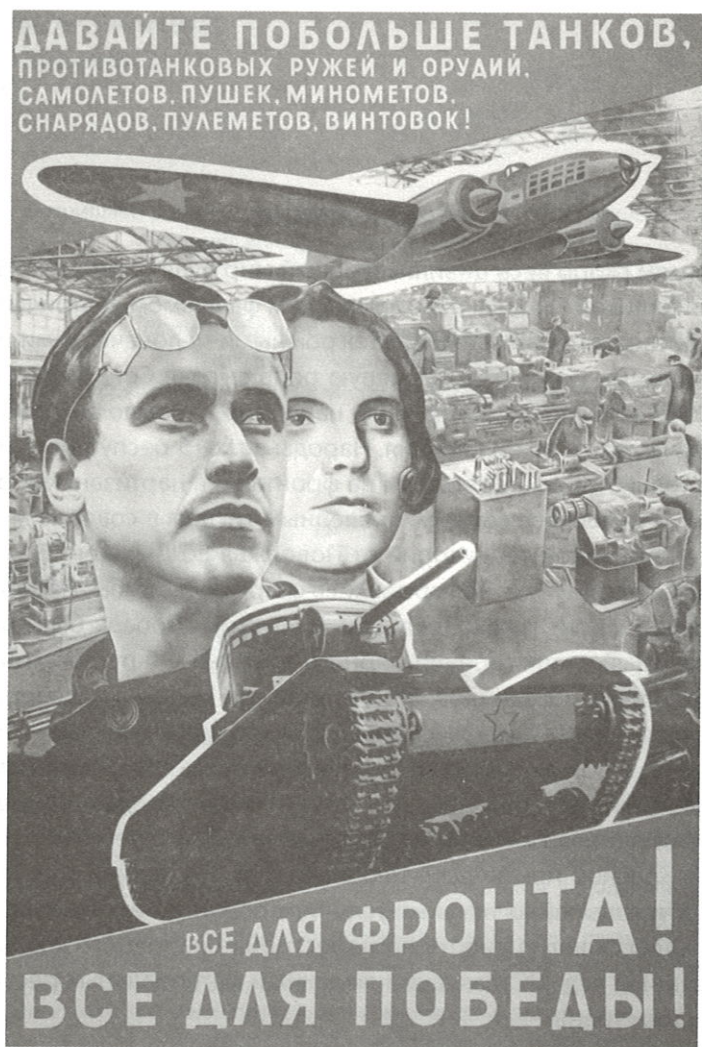
Плакат Л. Лисицкого «Все для фронта! Все для победы!». 1941 г.

ше выдержки в «народной толще». История Великой Отечественной войны советского народа доказала справедливость этих слов. Именно силу в «народной толще» продемонстрировал всему миру советский тыл, где на каждом рабочем месте шла своя война — за каждый час труда, за выдержку и терпение, за профессиональные смекалку и находчивость во имя победы над врагом и бесперебой-