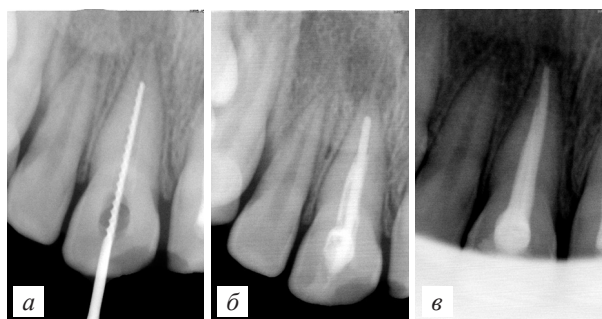
Рис.3. Этапы лечения зуба 1.1: а – определение рабочей длины канала, б – введение препарата гидроокиси кальция, в – окончательное пломбирование канала зуба

После обследования поставлен диагноз: К04.5 хронический апикальный периодонтит зуба 1.1. Проведено лечение согласно выше представленному алгоритму с временной obturацией корневого канала пастой с гидроксидом кальция (рис.3б), проведено окончательное пломбирование канала зуба (рис. 3в).