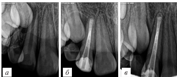
Рис. 1. Динамические изменения рентгенологической картины при временной obturации канала зуба пастой с антибиотиками: а – до начала лечения, б – после окончательного лечения через год, в – через 2 года после окончания лечения

При объективном осмотре выявлено: Конфигурация лица не изменена, повреждений кожи, губ не обнаружено. Слизистая оболочка рта бледно-розового цвета. Коронка зуба 1.2 разрушена, кариозная полость зуба сообщается с полостью зуба, зондирование полости зуба безболезненное. Отмечается неприятный запах изо рта. Зуб неподвижен. Перкуссия безболезненная. На интраоральной радиограмме (рис. 1а) коронка зуба разрушена, кариозная полость сообщается с полостью зуба. Корень несформирован, ростковая зона отсутствует. Определяется разрежение костной ткани с нечеткими границами, канал зуба свободен, прослеживается на всем протяжении корня.