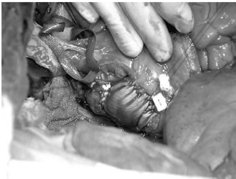
Рис. 2. Заплата из ксеноперикарда на стенке левого предсердия.

В послеоперационном периоде в течение 6 дней больной находился на ИВЛ в связи с развившимся отеком головного мозга. 20.10.2003 года больной пришел в сознание и экстубирован. 27.10.2003 года в удовлетворительном состоянии переведен для долечивания в НИИ онкологии и медицинской радиологии. 10.11.2003 года – выписан для амбулаторного лечения.