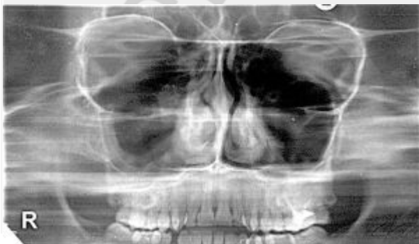
Рис.3. Панорамная зонограмма средней зоны лица

Метод ПАНОРАМНОЙ ЗОНОГРАФИИ (рис.3) является разновидностью ортопантомографии, позволяющей получить изображение более толстого слоя объекта (до 3 см), что повышает информативность метода.