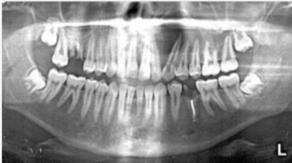
Рис.2. Панорамная томограмма нижней зоны лица

ОРТОПАНТОМОГРАФИЯ (панорамная томография) (рис.2) – метод, позволяющий получить изображение изогнутого слоя на плоской рентгеновской пленке. Во время съемки трубка и кассета с пленкой описывают неполную окружность вокруг головы больного (270°). Кассета при этом вращается еще вокруг собственной вертикальной оси, как бы «обкатывая» челюсти больного спереди. Рентгеновский луч проходит через щелевидную диафрагму шириной 2 мм, далее через анатомические структуры головы и лицевой части черепа и попадает на новые неэкспонированные участки пленки. Как и при линейной томографии, анатомические структуры, удаленные от пленки, проекционно увеличиваются, их изображение размывается. В современных ортопантомографах предусмотрены программы для изучения зубных рядов, костной структуры верхней, средней и нижней зон лицевого черепа, ВНЧС, а также краниовертебрального перехода, внутреннего и среднего уха, канала зрительного нерва. Имеется возможность изменять толщину и глубину изучаемого слоя.