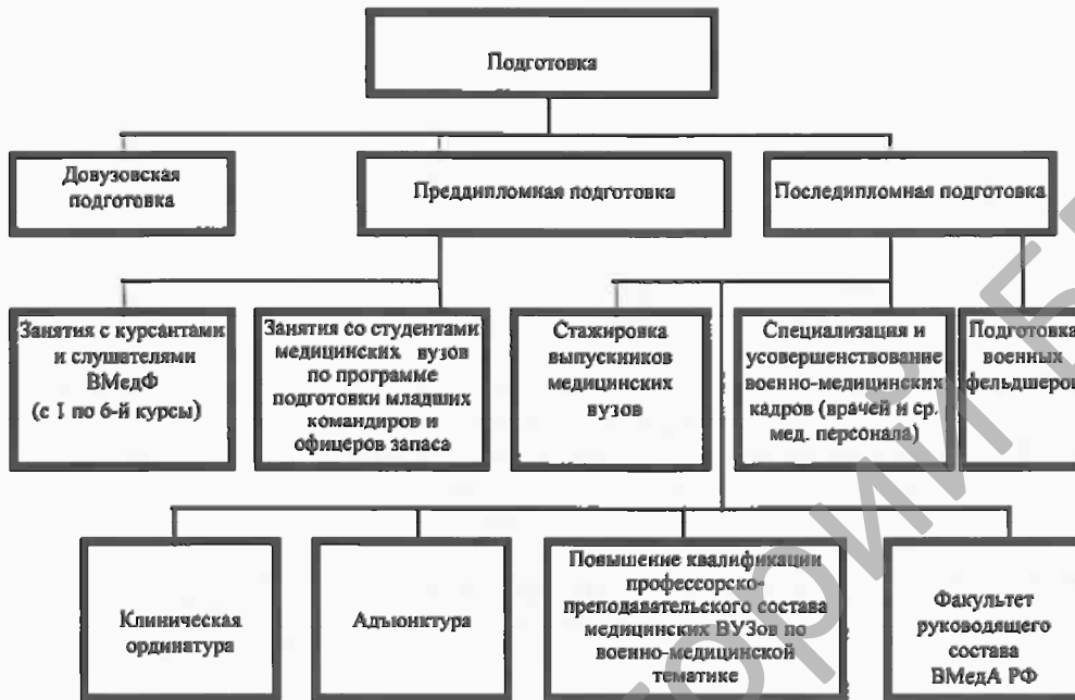
Рис. 1. Подготовка военно-медицинских кадров в Республике Беларусь