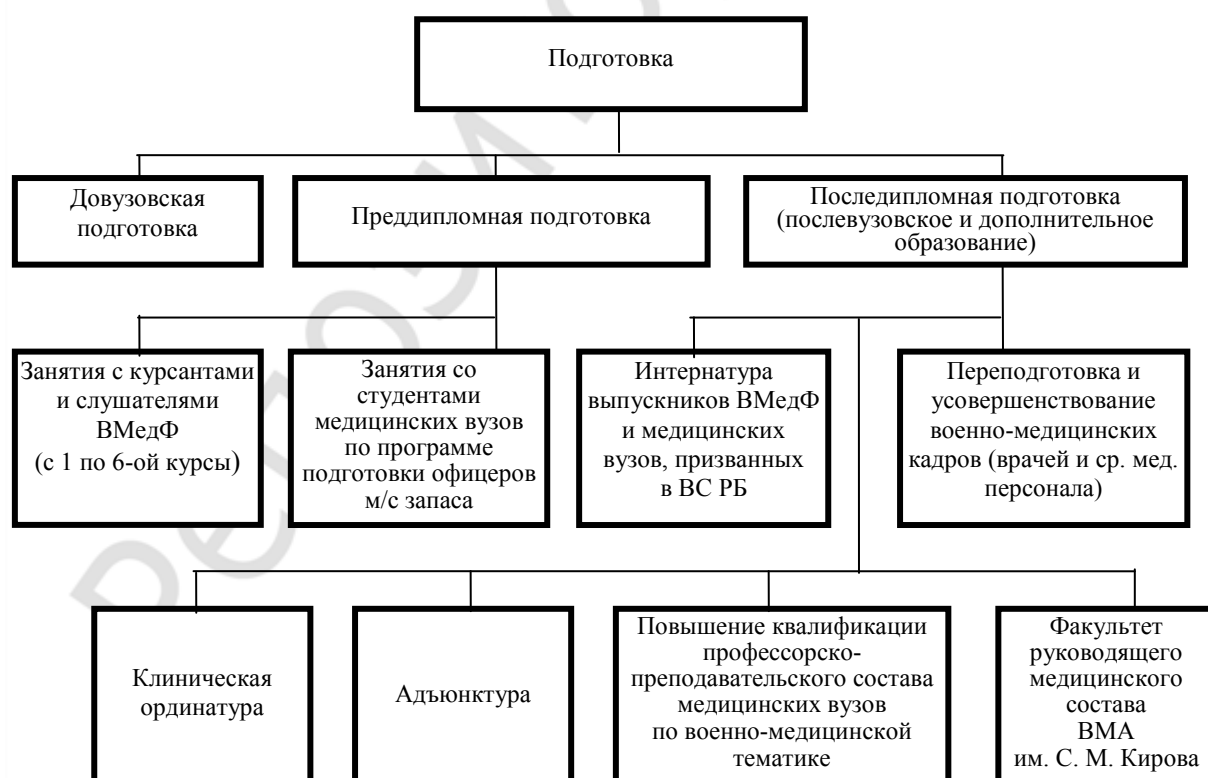
Рис. 1. Подготовка военно-медицинских кадров в Республике Беларусь

Исходя из этого предполагается, что национальная военно-медицинская профессиональная