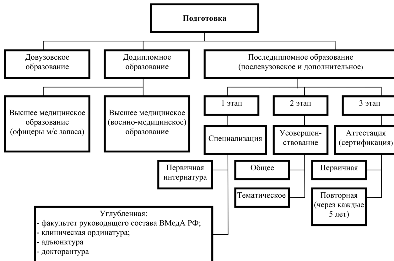
Рис. 2. Подготовка военно-медицинских кадров в Российской Федерации

школа должна соответствовать определенным базовым требованиям: