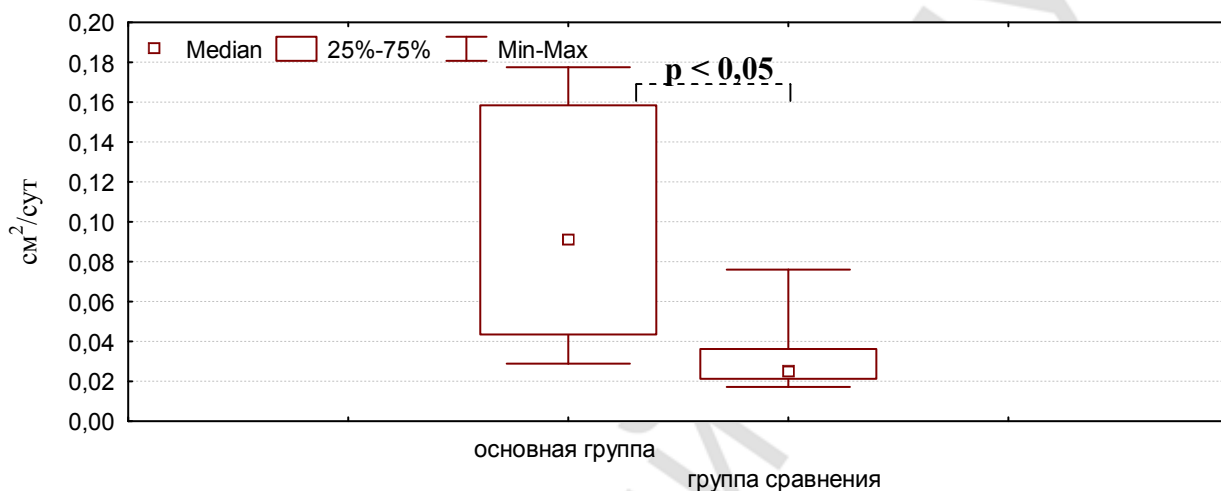
Рисунок 1. - Скорость эпителизации трофической язвы у пациентов основной группы и группы сравнения

Продолжительность стационарного лечения в обеих группах была сопоставима и составила 7 (5÷11) и 7,5 (5÷21) суток ( p > 0,05 ) соответственно. Время наступления полного заживления язв в основной группе оказалось меньше ( p < 0,05 ) на 10 суток, относительно группы сравнения (64,0 (58÷70,5) и 54,0 (41,0÷65,0) суток, соответственно).