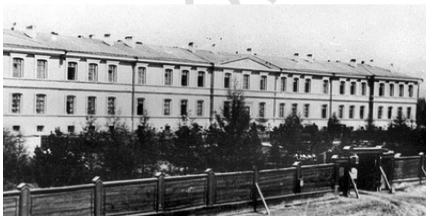
Рис. 4. Здание Иркутской военно-фельдшерской школы

В виду недостаточности названных выше 6 школ, разрабатывался вопрос об открытии еще двух – в городах Оренбурге и Ташкенте.