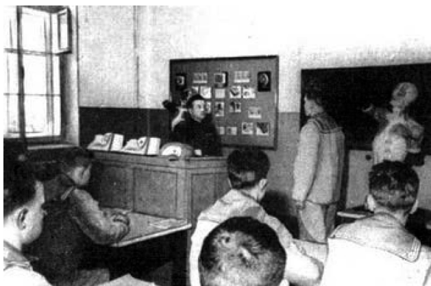
Рис. 5. Кронштадтское военно-морское медицинское училище. Курсанты роты фельдшеров на занятиях. 30-е года XX ст.

ским. На базе военно-медицинского училища было открыто «Омское медицинское училище № 3» республиканского подчинения.