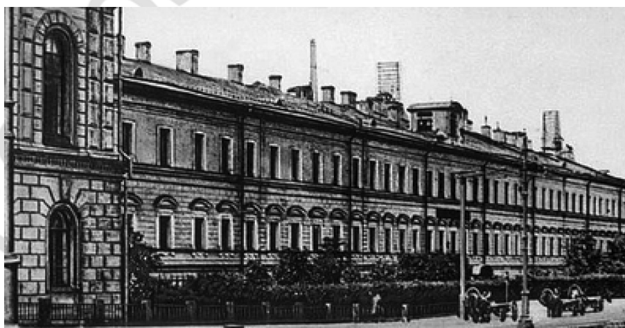
Рис. 2. Петербургская ВФШ в здании, расположенном на территории ИМХА

В начале XX в. в Вооруженных силах Российской империи имелось 6 ВФШ: Петербургская – на 300 «казенно-коштных» воспитанников (создана согласно приказу по военному ведомству от 1869 г., № 186) (рис. 2.); Киевская – на 350 воспитанников (Приказ по военному ведомству от 1898 г., № 340) (фото 1); Херсонская – на 200 воспитанников (Приказ по военному ведомству от 6.06.1879 г. № 6); Московская – на 300 воспитанников (Приказ по военному ведомству от 1871 г., № 241) (рис. 3); Тифлисская – на 200 воспитанников (Приказ по военному ведомству от 1895 г., № 313) и Иркутская – на 200 воспитанников (рис. 4.) (Приказ по военному ведомству от 6.06.1879 г. № 6) [5].