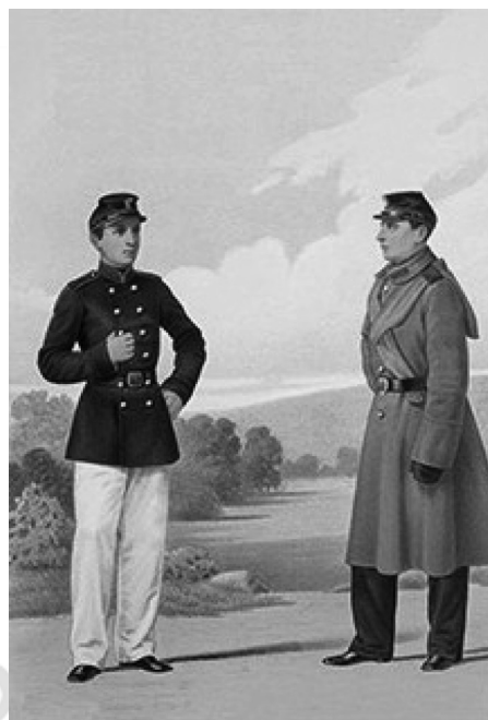
Рис. 1. Воспитанники ВФШ в форме 1869 г.

Школы этого типа, конечно, не могли выполнить такой задачи, так как в лучшем случае они готовили лишь военнотружущих, усваивавших технику фельдшерского дела, поэтому в отношении ВФШ типа 1838 г. вслед за реформой других военно-учебных заведений в 1869 г. была проведена собственная реформа. Устройство ВФШ типа 1869 г. было основано, с небольшими изменениями, на «Положении» от 26.04.1869 г. ВФШ «типа 1869 г.» представляла собой совершенно отдельное учреждение, с особой администрацией, собственным бюджетом