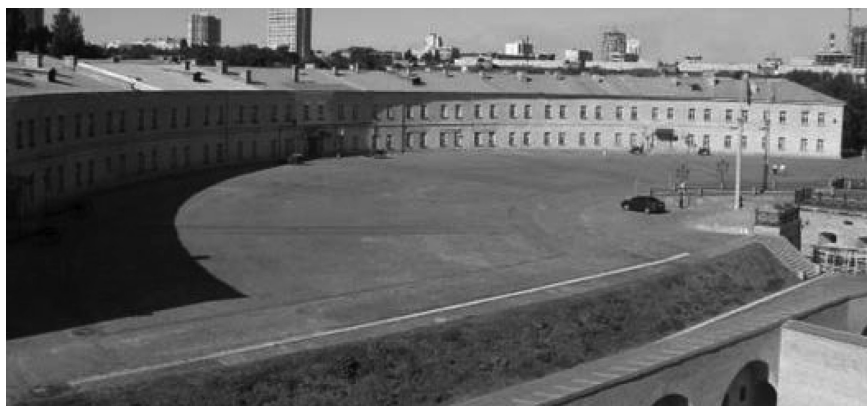
Фото 1. Киевская крепость 1839–1842 гг. В конце XIX в. здесь размещалась Киевская ВФШ