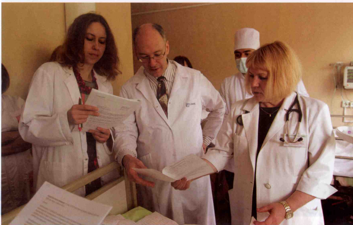
Консилиум с участием канадских интервенционных кардиологов в ОИТР УЗ «Городская клиническая больница скорой медицинской помощи г. Минска», май 2015 г.