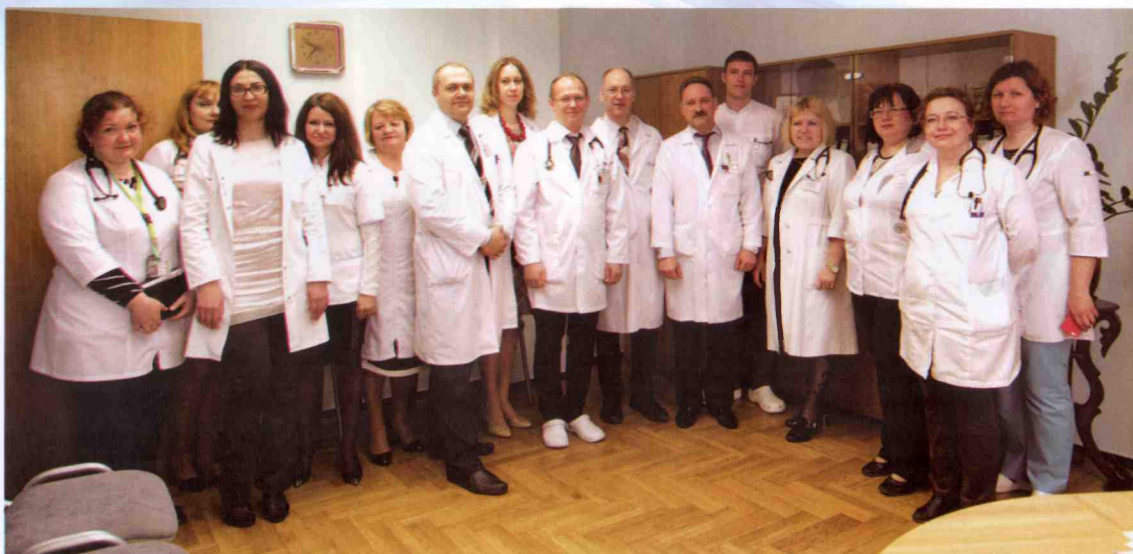
Встреча канадских интервенционных кардиологов и преподавателей кафедры кардиологии и внутренних болезней БГМУ с сотрудниками Городской клинической больницы скорой медицинской помощи г. Минска, май 2015 г.