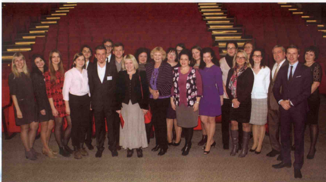
Коллектив кафедры кардиологии и внутренних болезней БГМУ. после окончания I Международного Минского медицинского форума, 2015 г.